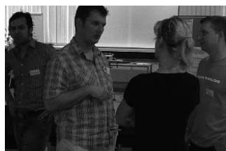
Seminarsgruppe im Gespräch

„Wie gewinne ich neue Kunden im Aufzug?“ Unter dem Motto: „Positionierung - anders sein; Inszenierung - spannend sein; Profilierung - bekannt werden“ haben 15 Teilnehmer in den Aufzügen des TZ geprobt, wie man potenzielle Kunden in kürzester Zeit für sich interessieren kann.